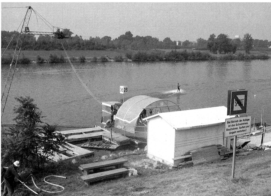
Freizeitparadies Donauinsel Wien.

Es ist deshalb wichtig, Sport- und Frei- zeitanlagen frühzeitig raumplanerisch zu erfassen, die nötigen Zonen zu schaffen und damit zweckdienliche Landreserven zu sichern. Sehr wichtig ist dabei die Be- urteilung der Emissionen, aber auch der Immissionen. Es ist ein legitimes Anlie- gen, Wohnüberbauungen vor Sportlärm