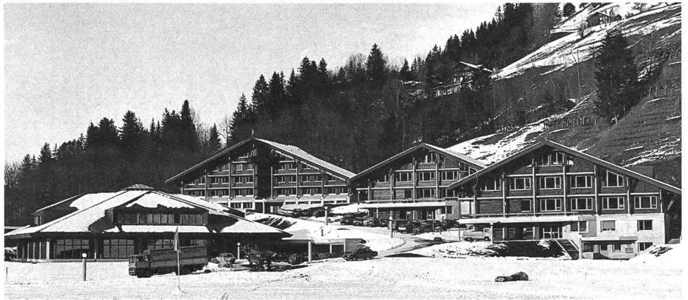
Freizeitsport für Viele: Kuspo Lenk.

In allen Bereichen wurde der Ruf nach verbesserter Information laut. Die Probleme, aber auch Lösungswege, sollen der Allgemeinheit bewusst gemacht werden. Der Sport muss sich ganz allgemein besser verkaufen. Wäre die Schaffung ei-