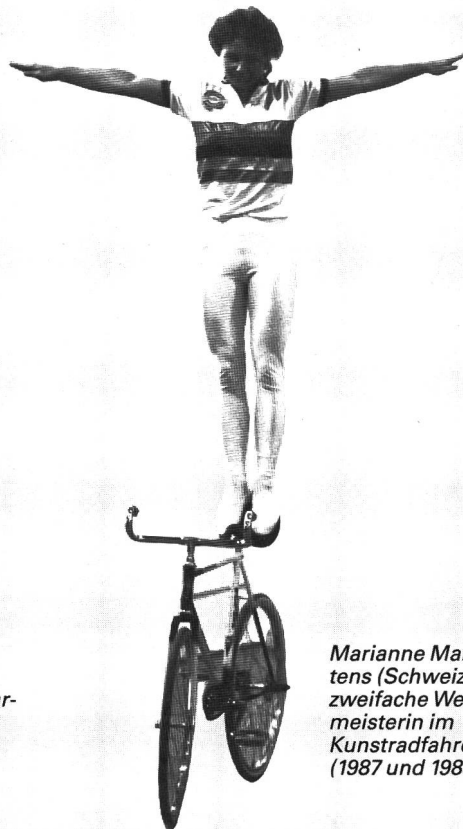
Marianne Martens (Schweiz), zweifache Weltmeisterin im Kunstradfahren (1987 und 1988).