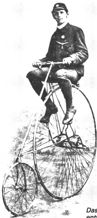
Das um 1882 entwickelte Star-Bicycle (USA) gilt als erstes Radball-Rad.