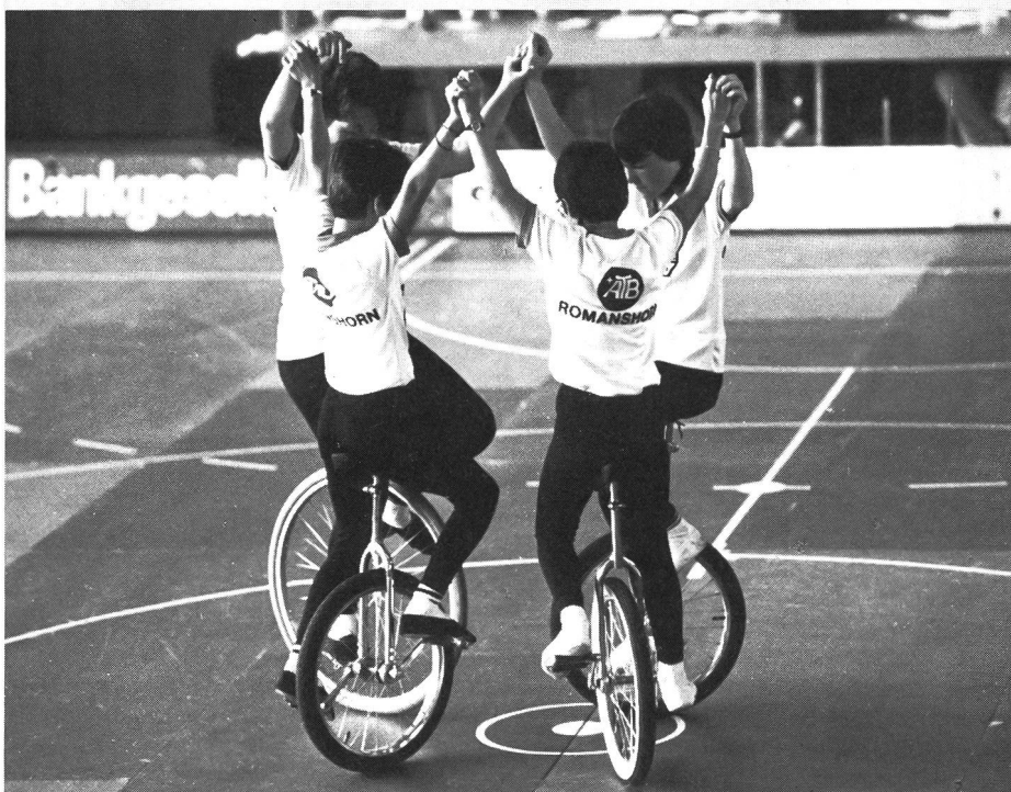
Gruppen- oder Reigenfahren, hier auf dem Einrad durch eine Jugendgruppe.