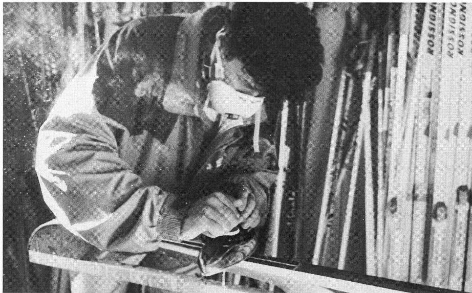
Kein Honiglecken: Moderne Pulvergleitmittel entwickeln beim heiss Einbügeln auf die Lauffläche unangenehme Dämpfe. Atemmaske ist Vorschrift.