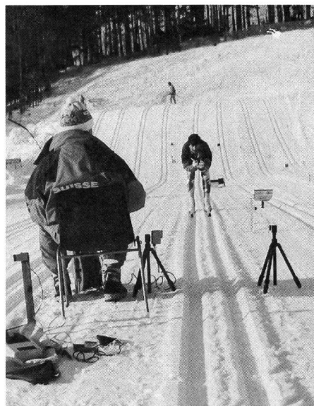
Gleittest: Testspur, Testfahrer, Lichtschranke und Testleiter, der das Testprotokoll führt.

Beim Abstosswachs ist die Gleitfähigkeit (Gleittest) nur ein Faktor im Opti-