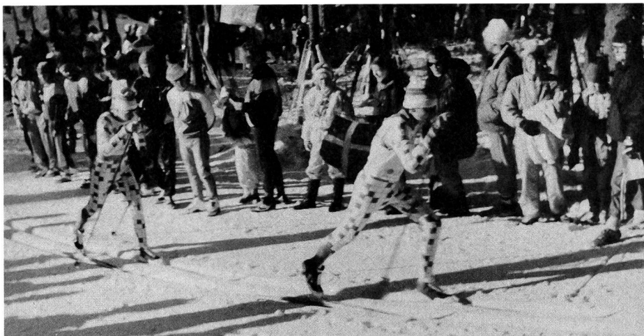
Nach dem Test der Wettkampf: Angriff der Schwedinnen.

Den Abstoss kann eigentlich nur der Läufer selber beurteilen. Dieses Urteil beruht zum grossen Teil auf dem Laufgefühl. Dieses muss entwickelt werden.