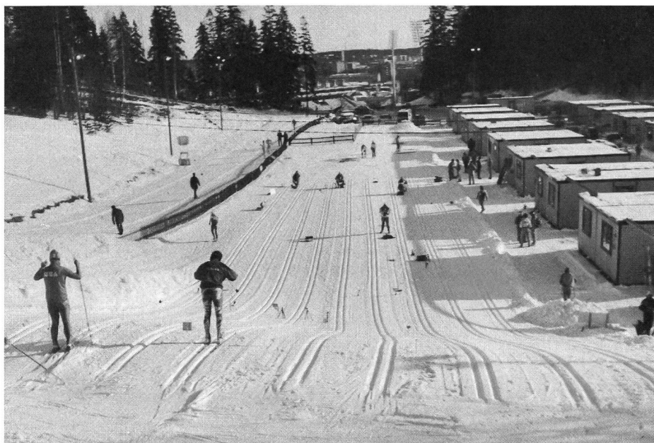
Gleitstestgelände und «Nationendorf der Wachshütten» WM Lahti 1989.