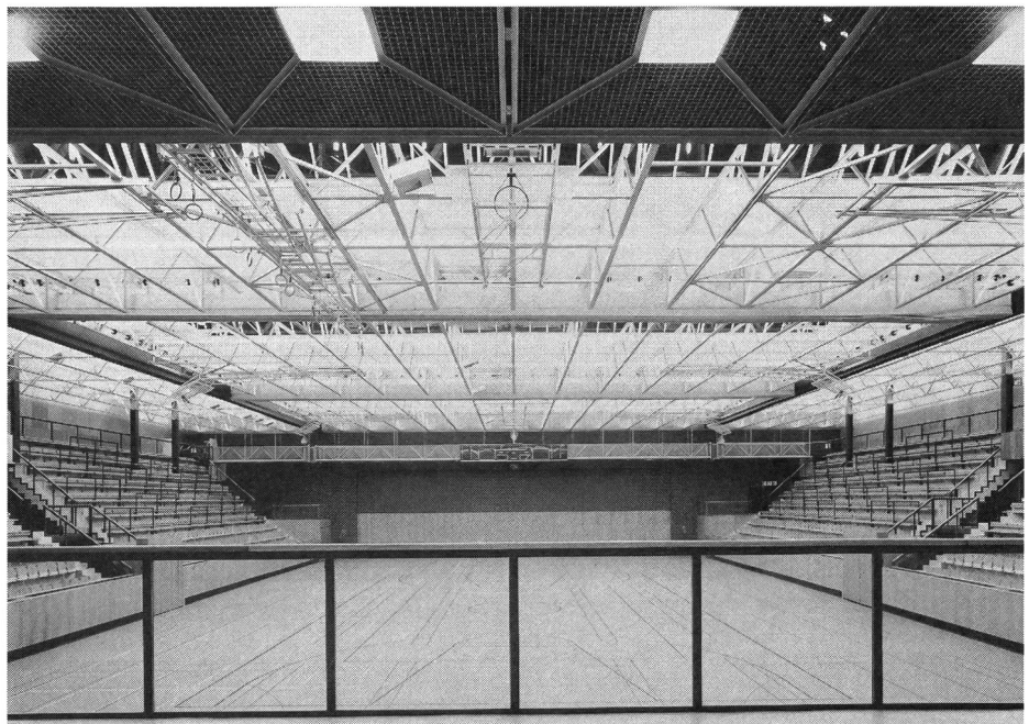
Innenraum mit verschiedenen Spielfeldmarkierungen und Zuschauertribünen.