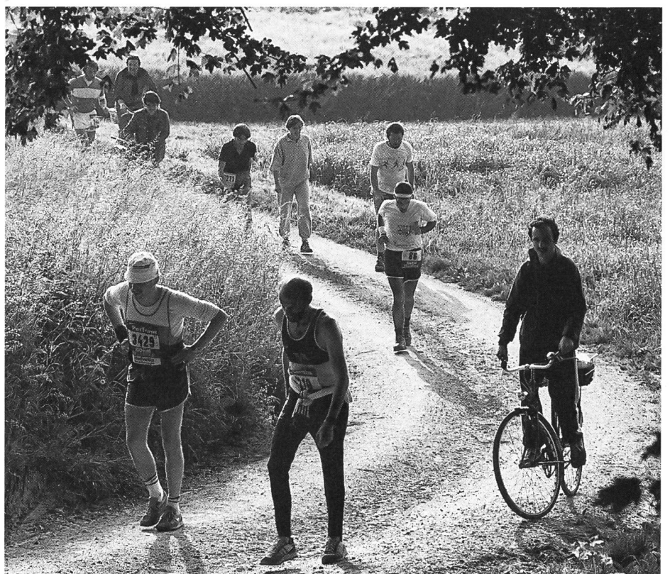
Sport in und mit der Natur.