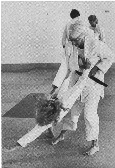
Jiu-Jitsu, für geübte Seniorinnen kein Problem.

Werden ältere sporttreibende Menschen nach den Beweggründen für ihr Tun gefragt, so wird von den meisten an erster Stelle die Gesundheit genannt. Nach der Definition der Weltgesundheitsorganisation wird darunter nicht nur das Freisein von Krankheit und Gebrechen verstanden, sondern ganz allgemein ein Zustand völligen körperlichen, seelischen und sozialen Wohlbefindens.