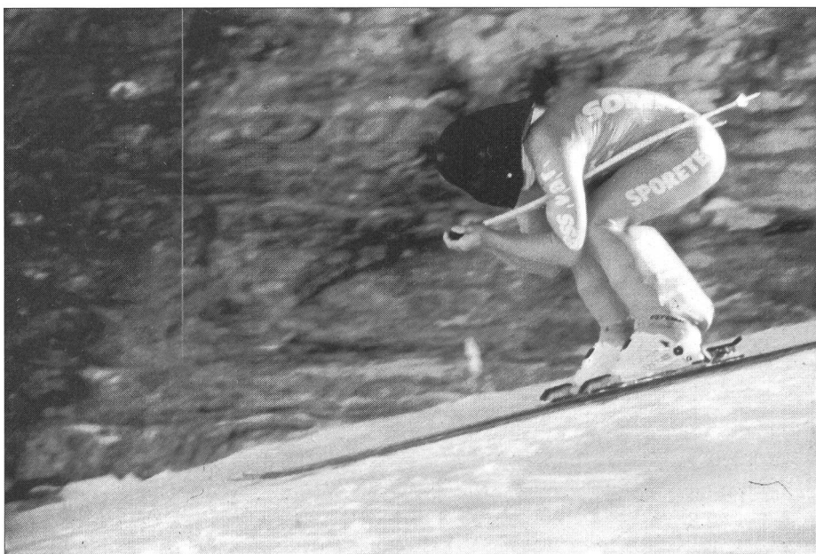
Die Aufnahme gibt das Gefälle nur ungenügend wieder. Die Ausrüstung ist deutlich zu sehen: Spezialhelm, gebogene Skistöcke, Skidress mit Spoilern hinter den Waden, Ski mit einer Länge von 2,4 Metern.

Morgen wird dank der besseren Vermarktung durch die Medien die Entwicklung zum sportlichen Schauspiel und zum Massensport vollzogen sein, wobei der einzelne versuchen wird, seine Leistung in Zahlen zu erfassen.