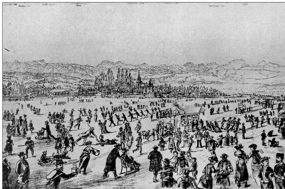
Eislaufen auf dem zugefrorenen Zürichsee 1891.

Der gleichfalls altem Brauchtum entstammende Brautlauf, finden wir in der Novelle «Die drei gerechten Kammacher», die alle um Züs Bünzli freien. Ein Lauf der Bewerber soll den Entscheid bringen, sagt sie doch: «Tretet diesen Weg an voll schönen Eifers, aber ohne Feindschaft noch Neid gegeneinander,