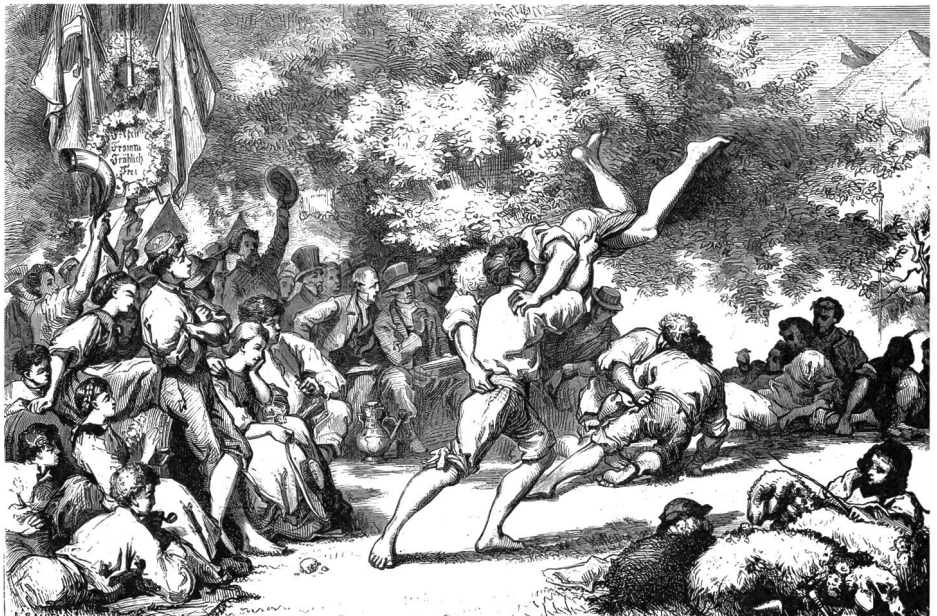
Schwingfest um 1875.

Zu Kellers Lebzeiten bedeuteten das Schiessen und die damit verbundenen Schützenfeste die grossen sportlichen Ereignisse, denen sogar vielerorts altüberlieferte einheimische Spiele zum Opfer fielen, um den Schiesswesen Platz zu machen. Neben Kellers begeisternden imaginären Schützenreden im «Fähnlein der sieben Aufrechten» hat er sein poetisches Talent auch immer wieder Schützenfesten zur Verfügung gestellt. Wir erwähnen hier das 1859 entstandene Poem «Schütz im Stichfieber», worin es unter anderem humorvoll heisst: