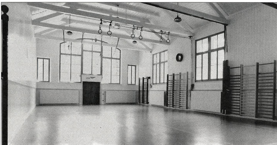
Sanierungen bedingen oft Kompromisse – hier bei der Beleuchtung; links einer der erhaltenen Reckpfosten der Turnhalle Matte, Bern.

Neue Garderoben mit Duschen werden als Vorbau neu in ein Untergeschoss gebaut, darüber entstehen die Geräteräume. Im Halleninneren wird neben der ganzen Geräteerneuerung, Wärmedämmung und dem neuen Bodenbelag die bestehende Decke isoliert und damit auch eine bessere Akustik erreicht.