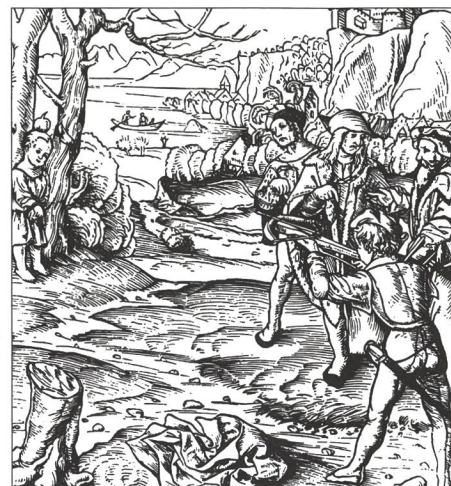
Eine der vielen Apfelschussdarstellungen.

Jener Wettkämpfer, dem das Kunststück gelang, an diesen vier bedeutenden «Spielen» zu gewinnen, durfte den Titel eines «Periodoniken» tragen, denn