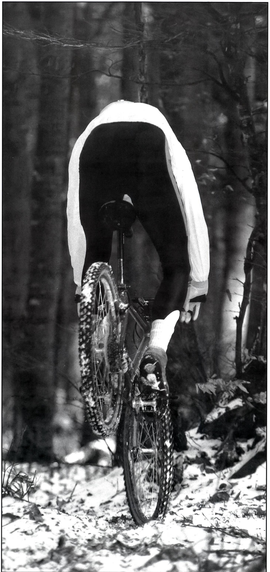
Mountain-Bike: Ein Sport auch für Akrobaten. (dk)