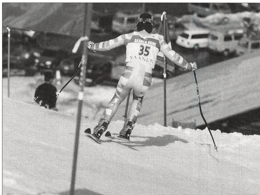
Ende des Schwungs → Kippen → Steuerung