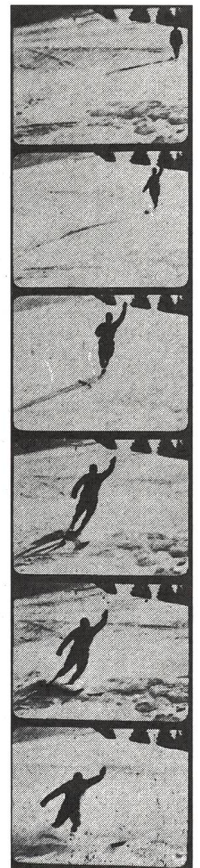
Schon damals ein Kristiania – auch als Querschwing bezeichnet.

(Aus: Die Ski-Schule von J. Dahinden, 1924)