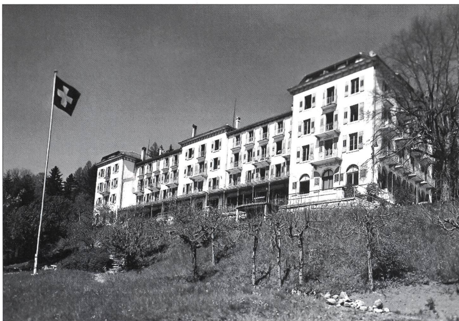
«Dieser zwar stattliche, aber von Zeichen des Verfalls geprägte Bau, mit seiner pompösen nach Süden gerichteten Aussichtsterrasse...»