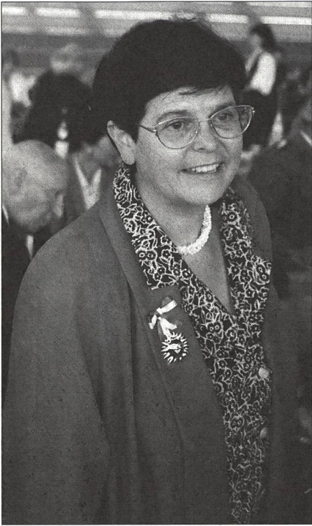
Die Departementschefin, Bundesrätin Ruth Dreifuss.