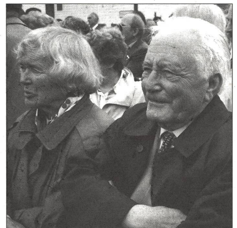
Georges-André Chevallaz, als Chef des EMD letzter Vorgesetzter der ESSM vor ihrem Wechsel ins EDI, in Begleitung seiner Frau.