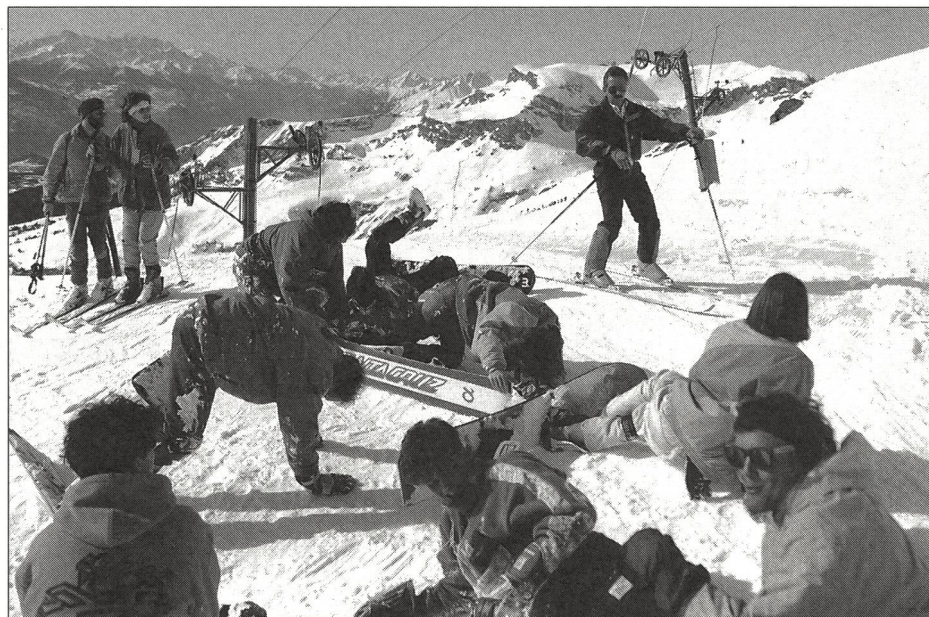
Bereits das Liftfahren ist ein Gefahrenherd.

Das Snowboarden scheint eine weitverbreitete Gleitsportart zu werden. Einige Kinder beginnen gleich mit dem Snow-