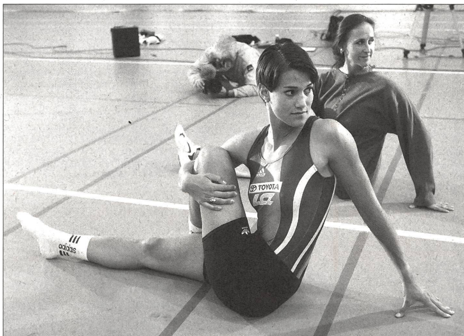
Die korrekte Körperhaltung ist wichtig. Alle Bilder zeigen diesen Aspekt, während den Videoaufnahmen für ein neues Medienpaket «Stretching» fotografiert.

Dynamische Massnahmen zur «Startvorbereitung» und zur Prävention von Verletzungen sind deshalb «funktionaler» als statische.