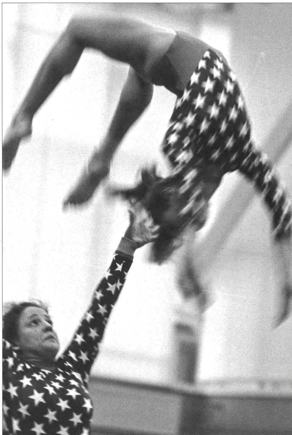
Symposiumsthema Akrobatisierung: Hier bei einer Partnerübung.

Krug verstand es aufzuzeigen, wie der Wunsch nach erhöhter Attraktivität in akrobatischen Sportarten dazu führt, dass letztlich die traditionellen Trainingssysteme aufgrund gezielter trainingswissenschaftlicher Forschung verändert werden müssen. Erhöhter Schwierigkeitsgrad drückt sich in entsprechendem technischen Niveau aus und dieses werde wesentlich durch die Flughöhe und die Drehgeschwindigkeit gekennzeichnet, ausgedrückt in gesteigerter Stabilität und Originalität der gezeigten Elemente. Die zunehmende Akrobatisierung zeige sich in einem Mehr an Flugelementen und in der Zunahme von Varianten, auch vor, über und nach dem Gerät. Diese Entwicklung sei nicht ohne Folgen geblieben. Es habe sich gezeigt, dass Leistungsstärkere signifikant kleiner und leichter an Körpergewicht seien, was wiederum Probleme im Bereich der frühzeitigen Spezialisierung, aber auch der Ernährung provoziere. Eine «qualitative Intensivierung» müsse deshalb angestrebt werden, denn das günstige Lernalter und ein vernünftiges Wettkampfalter klaffen immer mehr auseinander. Mehr Verantwortungsbewusstsein, und zwar sowohl in medizinischer, psychologischer als auch in pädagogischer Hinsicht sei mehr denn je eine unabdingbare Voraussetzung. ■