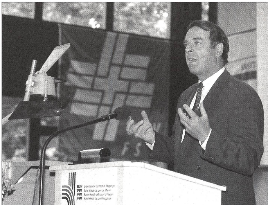
Bundesrat Adolf Ogi am STV-Jubiläum an der ESSM.

Im zweiten Teil dieser Jubiläumsveranstaltung führte der STV – als Beitrag zur stets notwendigen Förderung der