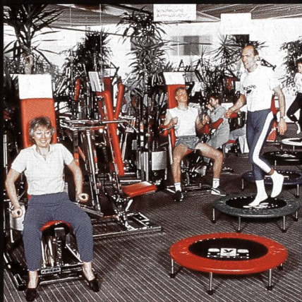
Freizeit- + Sportzentrum MIGROS Greifensee