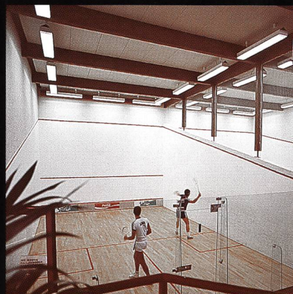
Swissair-Freizeitanlage Bassersdorf mit Squashcenter und Tennishalle

Fordern Sie noch heute unver- bindlich unsere Unterlagen an!