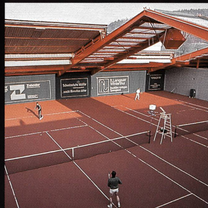
AGOB-Schiebedachhallen Tenniscenter Grütze Winterthur