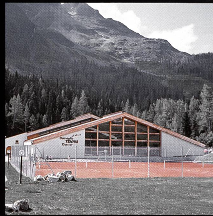
Corviglia-Tennis- und Squashhalle Kur- und Verkehrsverein St. Moritz