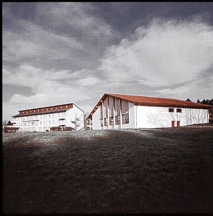
Bildungs- und Sportzentrum SVKT Chlotisberg Gelfingen