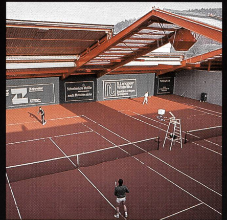
AGOB-Schiebedachhallen Tenniscenter Grüze Winterthur