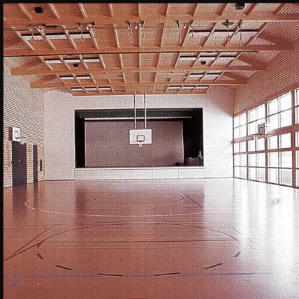
Mehrzweckhalle mit Bühne Progyzentrum Rebstein