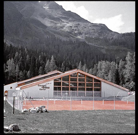
Corviglia-Tennis- und Squashhalle Kur- und Verkehrsverein St. Moritz