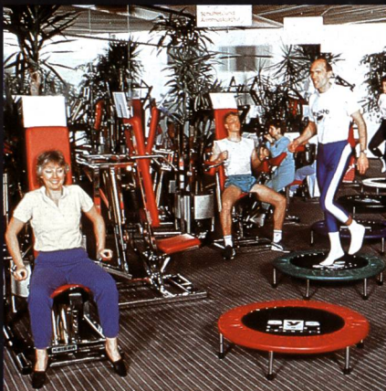
Freizeit- + Sportzentrum MIGROS Greifensee