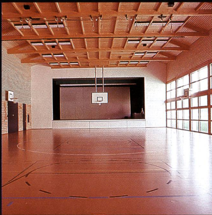
Mehrzweckhalle mit Bühne Progyzentrum Rebstein