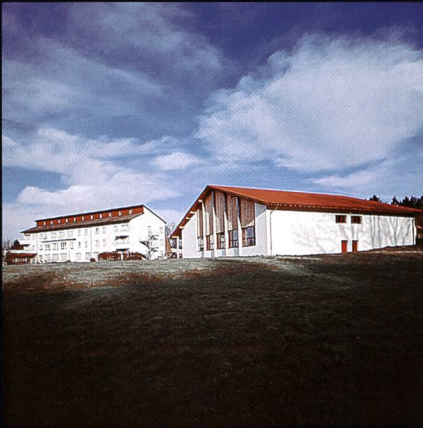
Bildungs- und Sportzentrum SVKT Chlotisberg Gelfingen