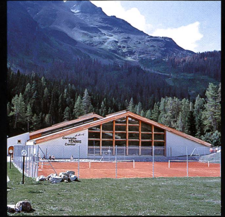
Corviglia-Tennis- und Squashhalle Kur- und Verkehrsverein St. Moritz