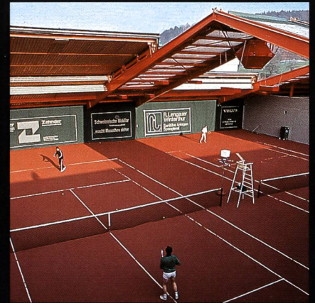
AGOB-Schiebedachhallen Tenniscenter Grütze Winterthur