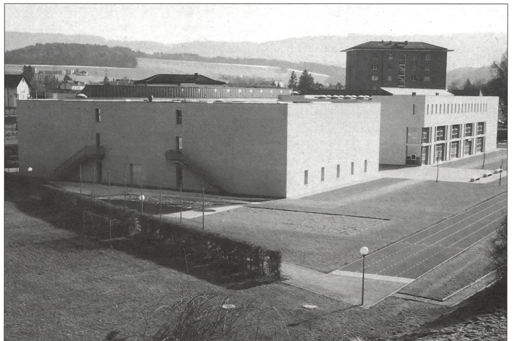
Sekundarschule mit Turnhallen Pruntrut.

Bevor der Bauherr einen Architekten, eine Architektin oder ein Architekten-team wählt oder bevor er einen Wettbewerb ausschreibt, muss er als Investor, Finanzträger und Besteller sein Ziel, sein Programm und den Kostenrahmen klar definieren. Wenn er darin selber keine Erfahrung hat oder wenn er nicht über die nötigen Organe verfügt, lässt er sich von einem kompetenten Fachmann beraten.