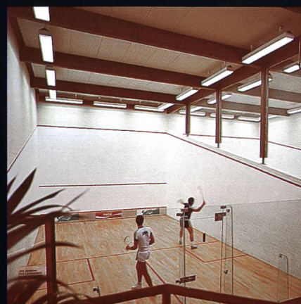
Swissair-Freizeitanlage Bassersdorf mit Squashcenter und Tennishalle

Riedhofstr. 45 Tel. 052 224 25 25 CH-8408 Winterthur Fax 052 224 25 10