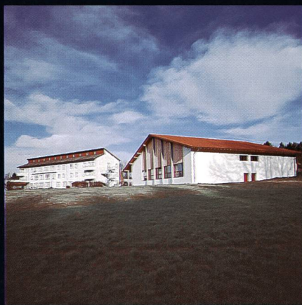
Bildungs- und Sportzentrum SVKT Chlotisberg Gelfingen