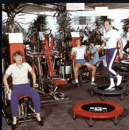
Freizeit- + Sportzentrum MIGROS Greifensee