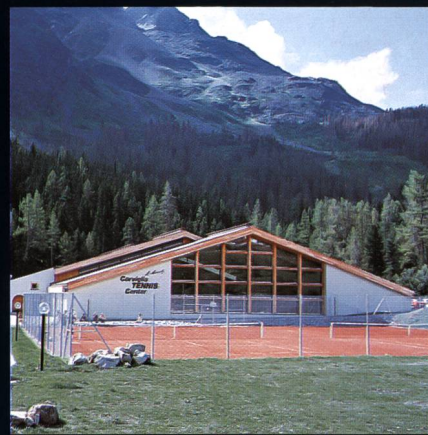
Corviglia-Tennis- und Squashhalle Kur- und Verkehrsverein St. Moritz