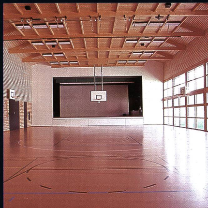
Mehrzweckhalle mit Bühne Progyzentrum Rebstein