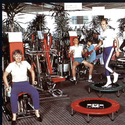
Freizeit- + Sportzentrum MIGROS Greifensee