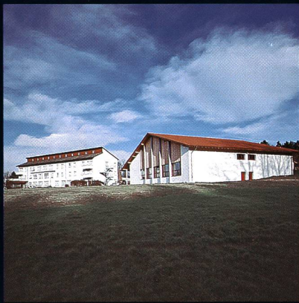
Bildungs- und Sportzentrum SVKT Chlotisberg Gelfingen