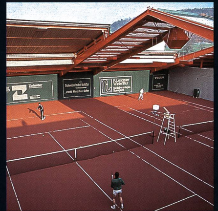
AGOB-Schiebedachhallen Tenniscenter Grütze Winterthur