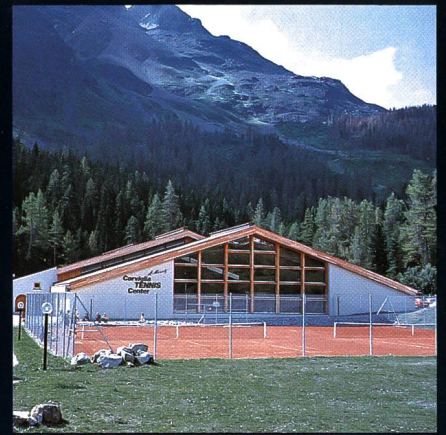
Corviglia-Tennis- und Squashhalle Kur- und Verkehrsverein St. Moritz