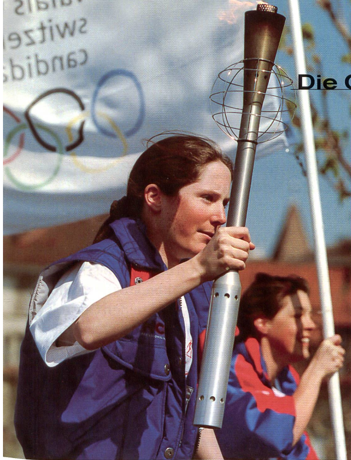
Olympische Spiele sind Ausdruck einer Idee.

das Risiko, missbraucht werden zu können: Bereits zu seiner Lebenszeit haben dies die Olympischen Spiele von 1936 in Deutschland (Garmisch-Partenkirchen und Berlin) deutlich gezeigt (vgl. Grupe/Krüger 1997, 115 f.).