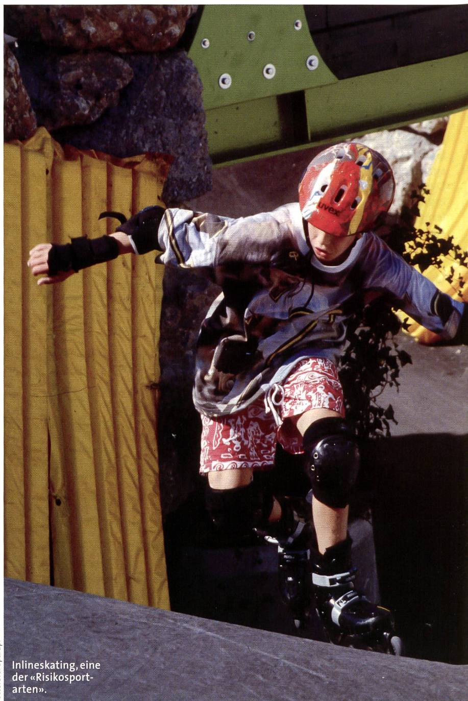
Inlineskating, eine der «Risikosportarten».

Aufgrund der verfügbaren statistischen Daten kann nicht mit Sicherheit angenommen werden, dass die Prävention der Sportunfälle in den letzten Jahren wirklich gute Ergebnisse erbracht hat. Es drängt sich deshalb spontan die Frage auf, ob die Unfälle im Sport nicht eine Re-