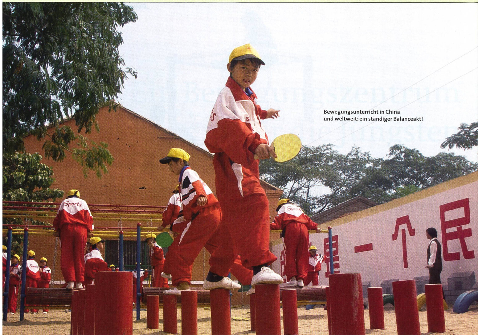
Bewegungsunterricht in China und weltweit: ein ständiger Balanceakt!