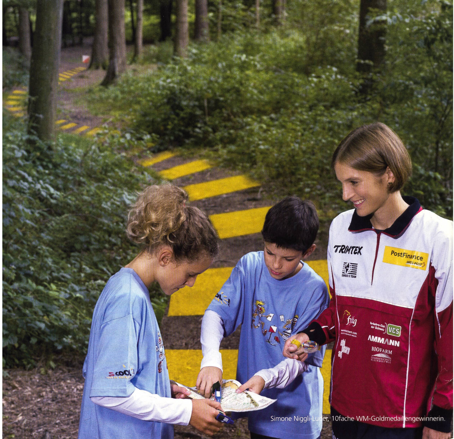
Simone Niggli-Luder, 10fache WM-Goldmedaillengewinnerin.