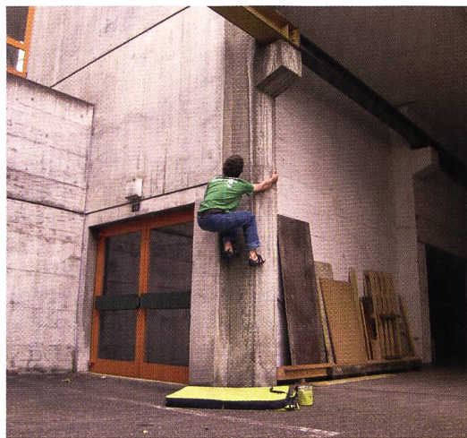
Bouldern in Bern: «Es warten über 200 schöne Probleme darauf, begriffen zu werden.»

Teamsport – Beachvolleyturniere auf öffentlichen Plätzen sind heutzutage keine Seltenheit und zudem sehr publikumswirksam. Ein bekanntes Beispiel dafür, wie sich das Themenfeld Spielen an der Rückgewinnung von städtischen Räumen beteiligt, ist auch die Basketballvariante Streetball und seit neuestem Beach Soccer. Hinzu kommen Inlineskatehockeyturniere in Parkhäusern und nicht zuletzt auch die Umgestaltung von Pausenplätzen, die das Spielen auf asphaltiertem Untergrund ermöglichen.