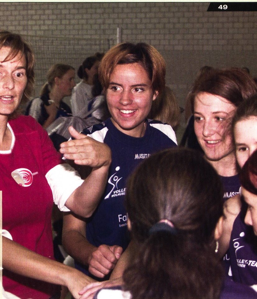
Der Selbstwert von Schülerinnen und Schülern wird durch gute Beziehungen mit Lehrpersonen gestärkt.

■ Beispiel: «Die Aktivität hat zu einem Vertrauensaufbau mit dem Sportlehrer / Trainer geführt.»