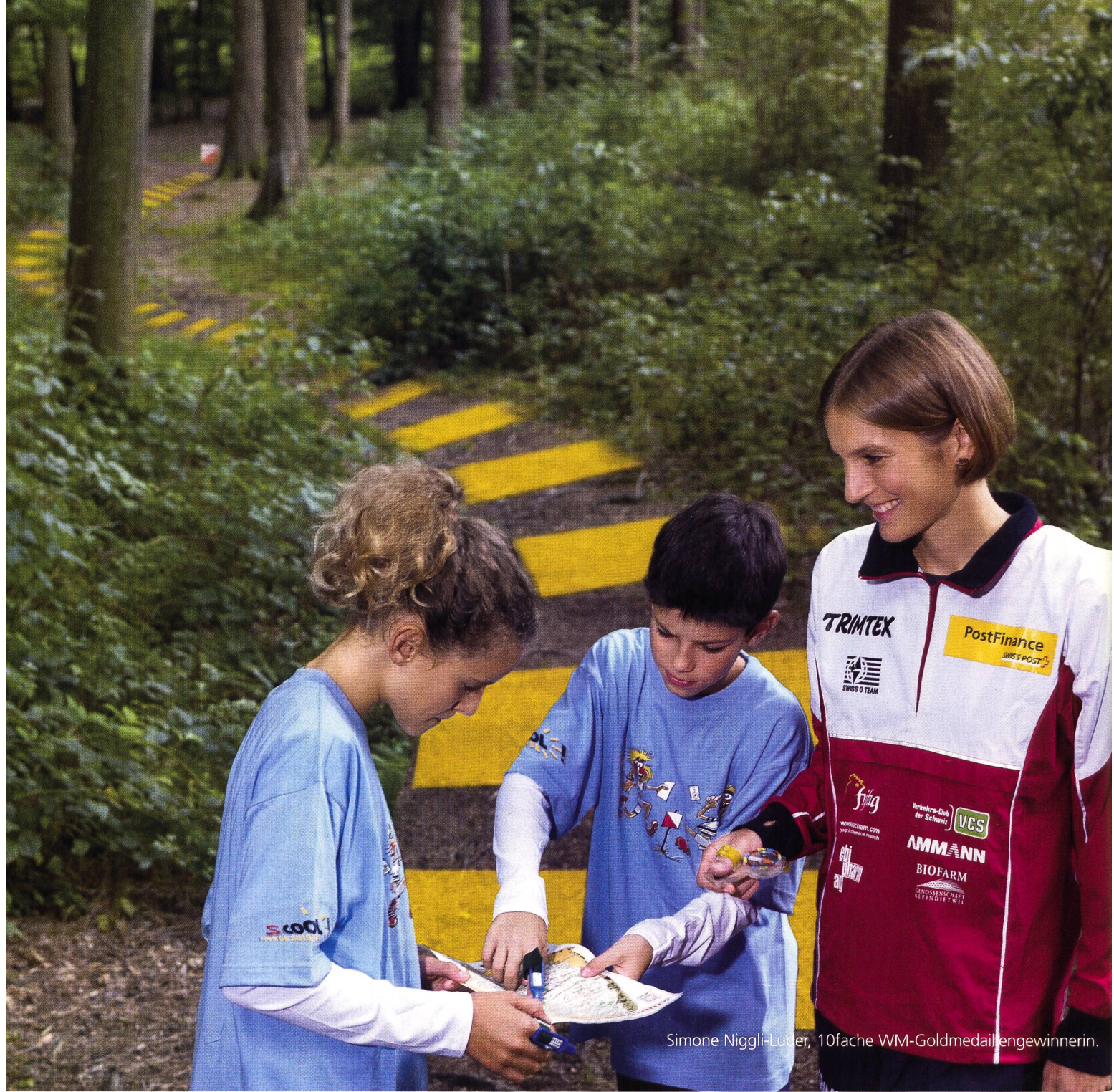
Simone Niggli-Luder, 10fache WM-Goldmedaillengewinnerin.