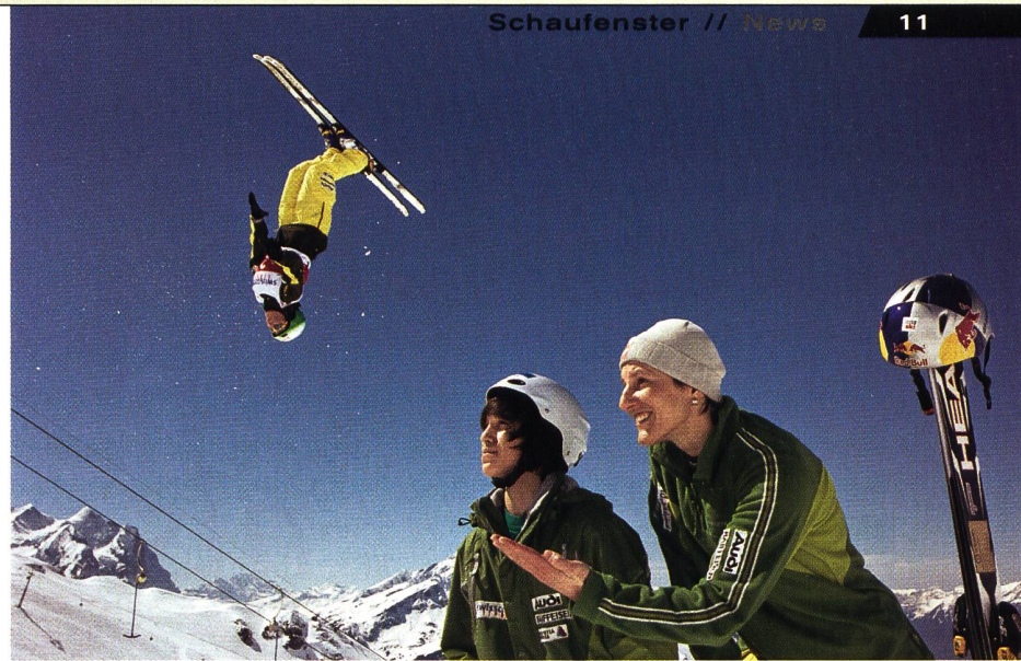
Zusammen mit der Bildagentur Keystone veröffentlicht die Sporthilfe zum dritten Mal einen eigenen Kalender. Für mobileclub-Mitglieder gibts ihn günstiger (siehe S. 40).

Die Sporthilfe, deren Zweck die Unterstützung des leistungsorientierten Schweizer Nachwuchssports ist, will zusammen mit SwissFundraising Erfahrungen in diesem