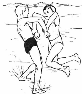
Prise de libération, aux poignets.

Le moniteur averti s'assure son personnel de surveillance et d'enseignement futur en faisant instruire ses bons nageurs en vue du brevet I de la Société suisse de Sauvetage . Cette instruction peut se faire, soit dans un cours spécial, publié dans la presse et organisé dans toutes les