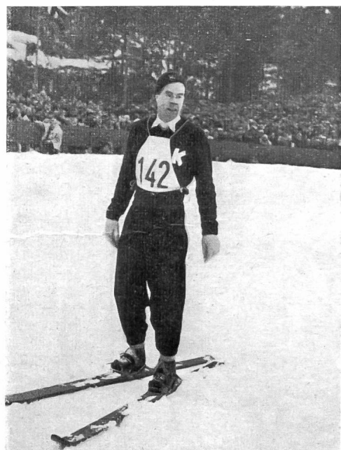
Asbjörn, le jeune champion de saut.

que des 18 et 50 km. à Chamonix, en 1924, J. Grøttmusbraaten, qui fut deuxième au classement des 18 km. à Chamonix, qui obtint quatre ans plus tard la médaille d'or à St-Moritz et qui gagna le combiné nordique aux championnats de la F. I. S. à Lahtis ; Lars Bergendhal, le champion du monde de Chamonix et le populaire Finlandais Pekka Niemi ; parmi les sauteurs, ceux également bien connus chez nous, tels Ole B. Andersen, Birger Ruud, Reidar Andersen, Sven Selanger et le jeune Asbjörn Ruud.