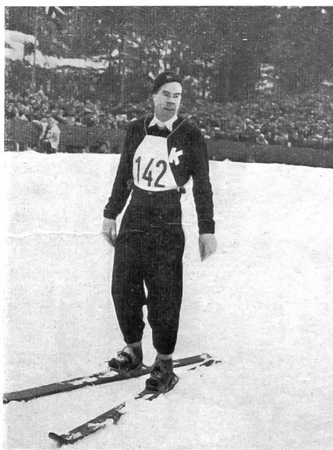
Asbjörn, le jeune champion de saut.