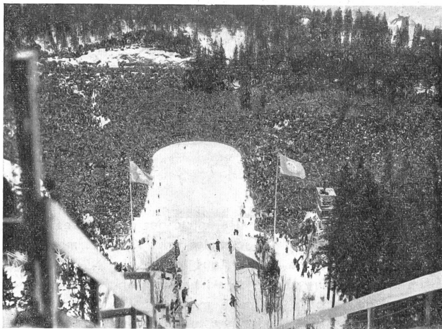
Le tremplin de saut de Holmenkollen, vu du haut de la tour d'Uan.

Le 3 mars 1946, pour la première fois après une longue interruption, les concours de Holmenkollen purent être à nouveau organisés et