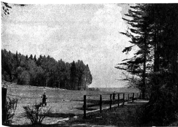
LE STADE DES MELEZES avec sa piste d'entraînement de 300 mètres est situé dans un cadre franchement idyllique.

beaucoup de sections de gymnastique et de clubs sportifs négligent!). Elle a pour but de donner au corps la préparation nécessaire pour les efforts croissants à venir. L'échauffement se compose de course (jeux de course), faite, ce qui est préférable, en dehors de la piste, d'exercices de culture physique et de réactions. Il est clair que tout ceci est travaillé suivant le rythme personnel de chacun et non en section. Après 10-15 minutes le corps est échauffé et prêt. Nous arrivons au noyau de la leçon. Nous ferons, avant tout, des exercices athlétiques, puis l'accent principal sera porté sur la gymnastique acrobatique, la gymnastique aux engins, concours de jeux individuels et autres. Aucune