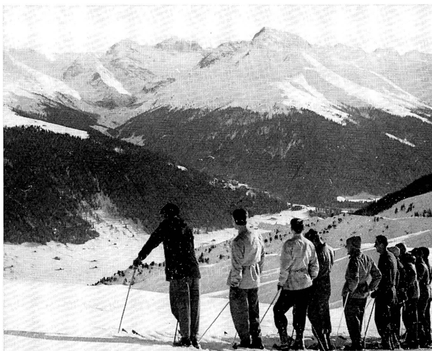
Après le déjeuner, nous nous retrouvons par classe, sur les champs de neige, face à un panorama tout simplement grandiose.

ADMINISTRATION : Office central fédéral des imprimés et du matériel, Berne 3. Compte de chèques postaux III/520.