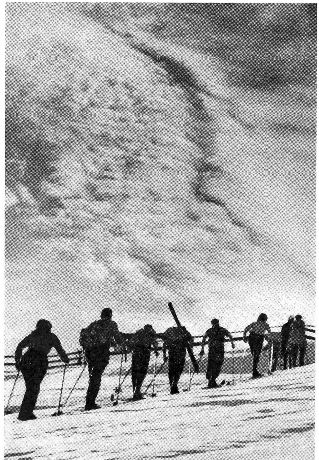
Quand viendra la neige...

physique de nos enfants, manquent en général de compétence, de largeur de vue, de temps ou de moyen d'assurer leur rôle.