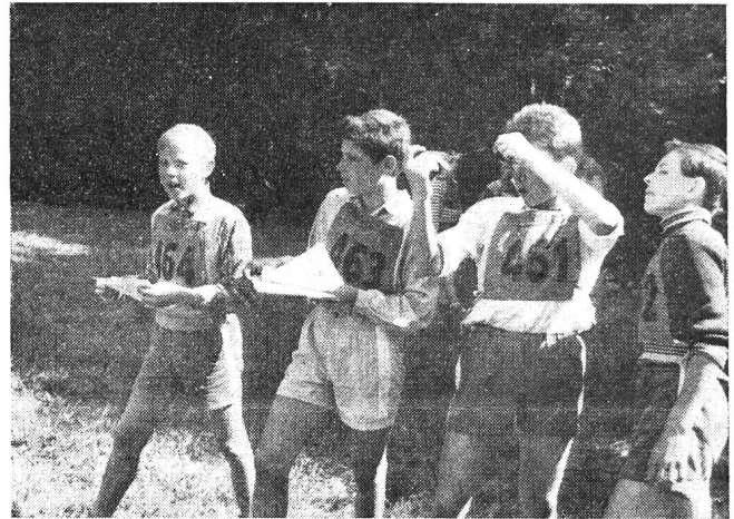
Les « chenillards » du Gr. E. P. Dombresson sont tout à leur affaire.

Cette année, les organisateurs — la commission cantonale E. P. — avaient imaginé toute une série de difficultés nouvelles. C'est ainsi qu'à un poste, les concurrents se trouvèrent devant des photographies aériennes de la région. Ils devaient alors relever sur leurs cartes, un point indiqué sur la photographie. Ailleurs, ils