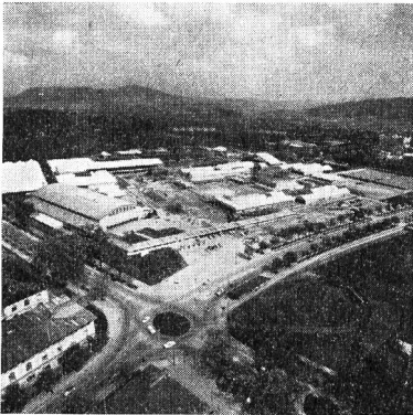
L'HYSPA, près de la place Guisan, occupe une superficie de 160000 m 2 . Les halles sont toutes sous toit.