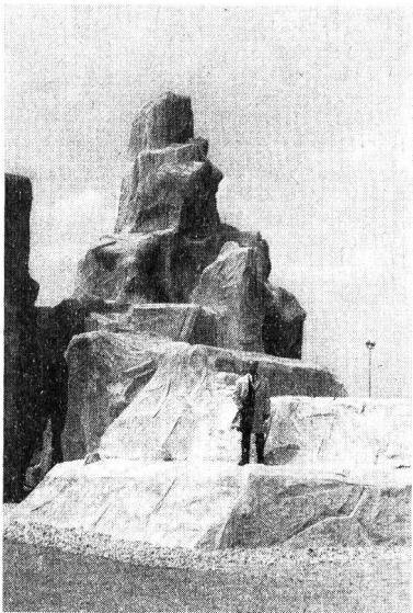
Le rocher de varappe en ciment : école d'alpinisme