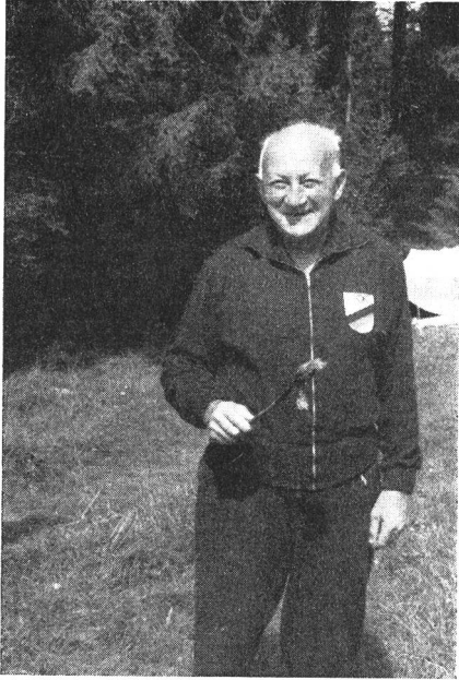
M. le Prof. Karl Diem, le souriant initiateur et réalisateur de l'Académie olympique se régale d'un délicieux bifteck rôti sur braises.

moignèrent oralement et par écrit : « Nos athlètes légers se félicitent des mesures ainsi prises par le gouvernement de la RDA pour la défense de ses frontières et le soutiennent activement. »