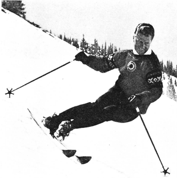
Fig. 6 Photo extraite de « Incorporating skilife »