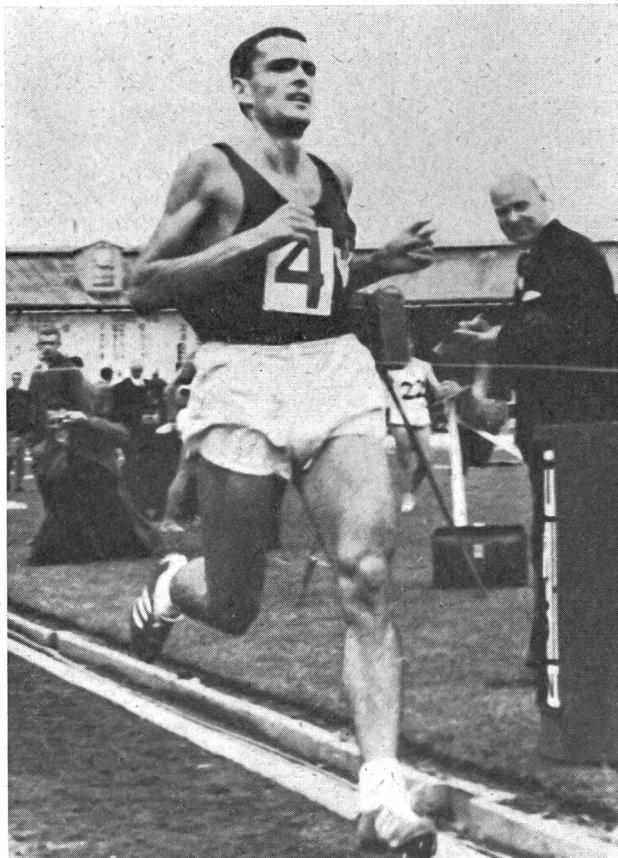
Ron Clarke, un pionnier...

Nous avons parlé plus haut des modifications survenant dans l'organisme humain soumis à un climat d'altitude. Or, ces modifications se maintiennent durant un certain temps encore après le retour à des conditions normales. Durant combien de temps ? Une semaine pour les uns, 18 à 25 jours pour d'autres, voire davantage encore. (Notons à ce sujet que la durée de vie des globules rouges est de 120 jours).