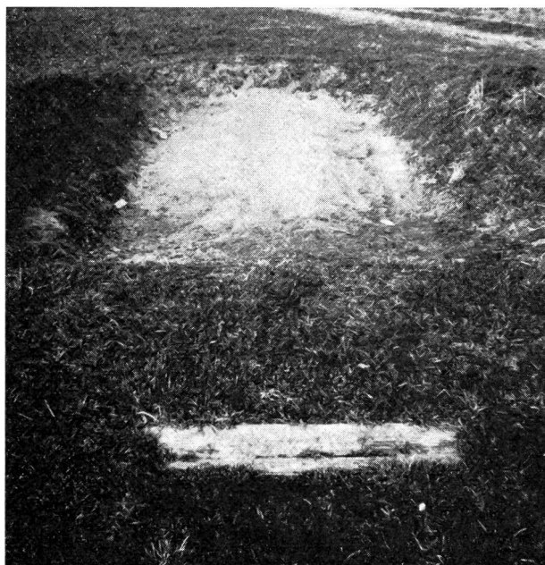
Une fosse et une piste de saut comme on en voit beaucoup !

Le cas pendable suivant s'est produit il y a quelques années. L'instituteur d'un village a réuni la jeunesse. On décida de commencer un cours de base neutre. Le matériel était là, mais aucun emplacement n'était aménagé. A l'entrée du village un terrain vague de 4 à 5 m de large et 50 m