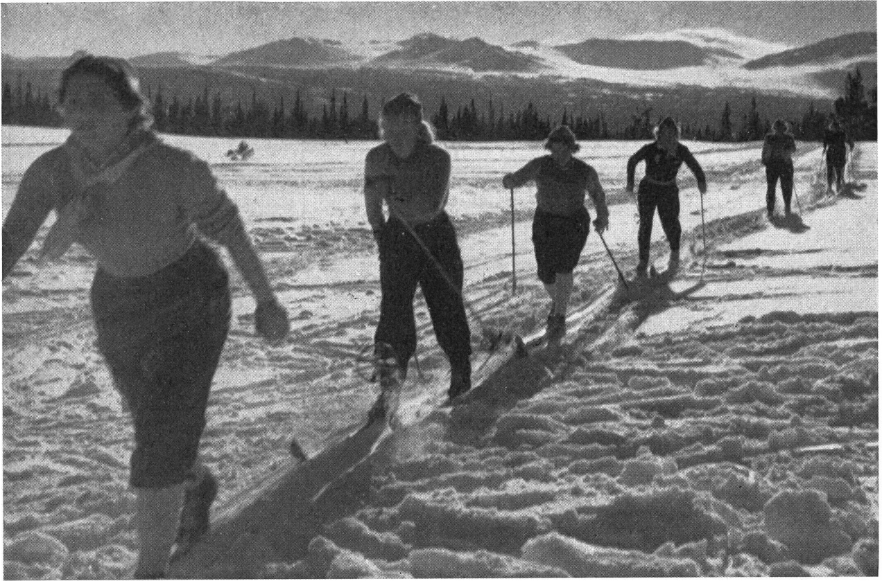
En haut: les participantes à un congrès des organisateurs de compétitions internationales féminines qui profitent, à skis de fond, de l'excellent terrain d'entraînement.