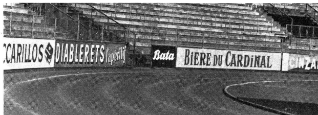
Le «stade», ce lieu saint où devrait se forger la santé et la joie de vivre, se prostitue à la publicité des tabacs et des apéritifs...