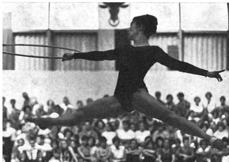
← Bulgarie, gymnastique moderne.