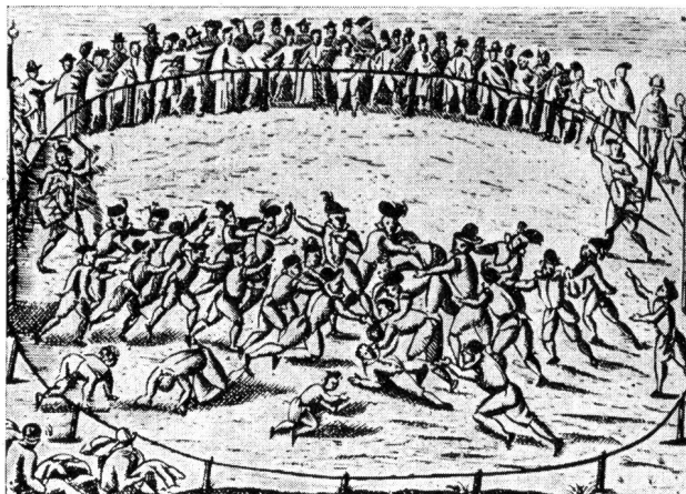
Cette illustration est tirée de l'ouvrage d'Antonio Scaino sur le «Gioco del Calcio», datant de 1555. On remarquera, en particulier, les deux tambours, aux extrémités du terrain, dont la mission était d'encourager les joueurs.

déjà en Chine, il y a près de 2500 ans où on le connaissait sous le nom de «Ts'uhküh». On peut en suivre la trace à travers le Japon, l'Empire romain, à travers le Moyen Age et la Renaissance où Antonio Scaino, en 1555, «s'explique de façon approfondie sur le sport de la balle dans le premier manuel édité dans ce domaine. Il expose en détail les règles du «Calcio» où, déjà, on manipulait avec les mains et les pieds, un ballon préalablement gonflé. La place de jeux était si longue que même le lanceur le plus aguerri ne pouvait lancer une