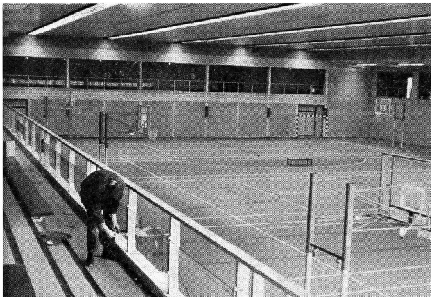
Université de Louvain. Nouvelle salle de sport avec un revêtement en tartan. Contenance 600 spectateurs. Les panneaux de basketball peuvent disparaître dans le sol.

Les différentes visites organisées ont été judicieusement choisies: le traditionnel tour de ville, court et bien dirigé; la visite de l'Université de Louvain, 25 000 étudiants, avec comme principale attraction, la nouvelle salle de sport (60 x 30 m.), revêtement en tartan, qui peut facilement se transformer en 3 terrains de volleyball, de basket ou en terrain d'athlétisme en manoeuvrant des boutons de commande qui font surgir automatiquement du sol les panneaux de basket, la fosse à sable, etc.