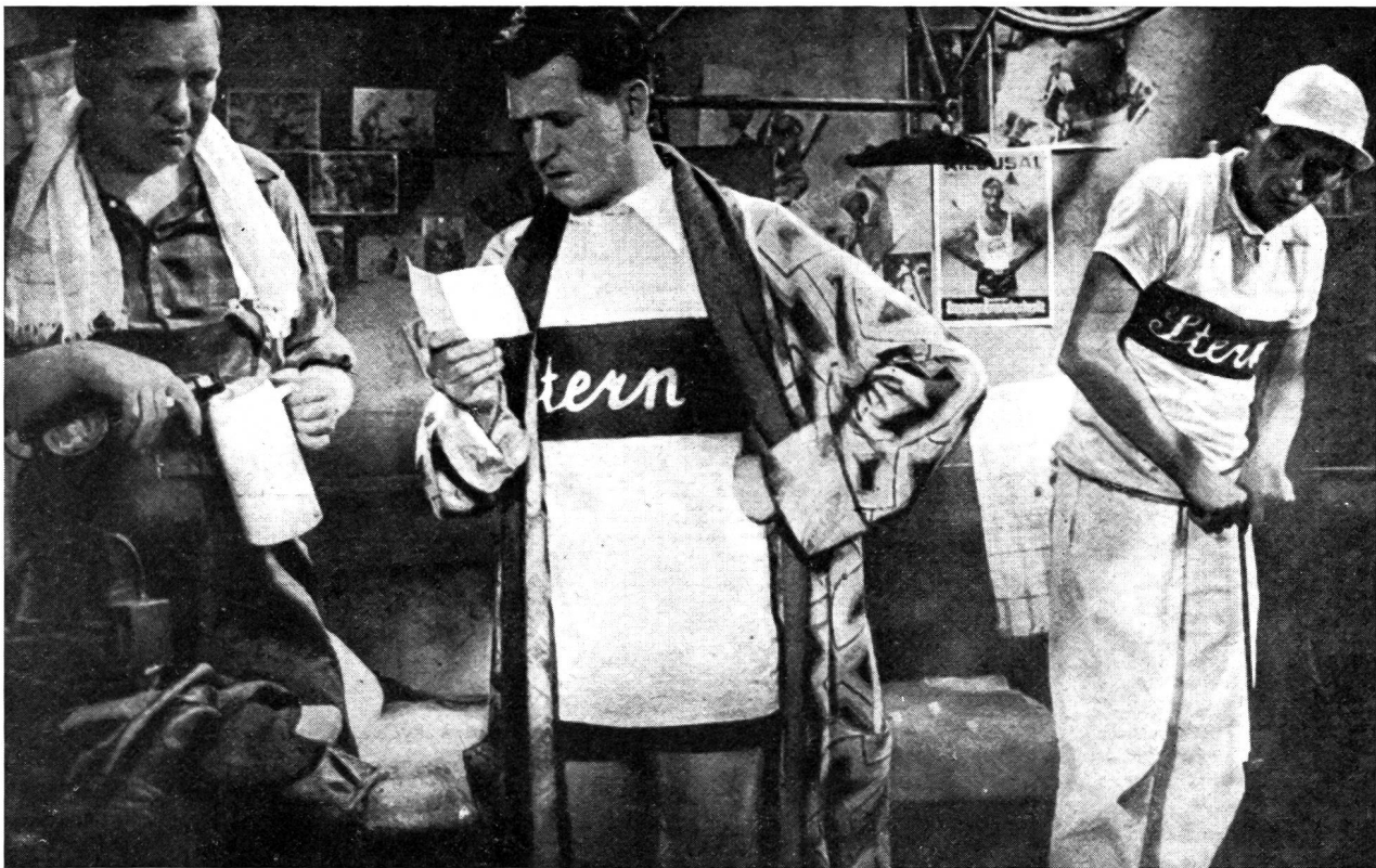
Albert Préjean, dans une scène de «Rivaux de la Piste», film de Serge de Poligny (1933). Dans le rôle de Willy Streblov, le Sayer, Albert Préjean joua «Juste». On reconnaît, à sa droite, le sympathique Aimos.