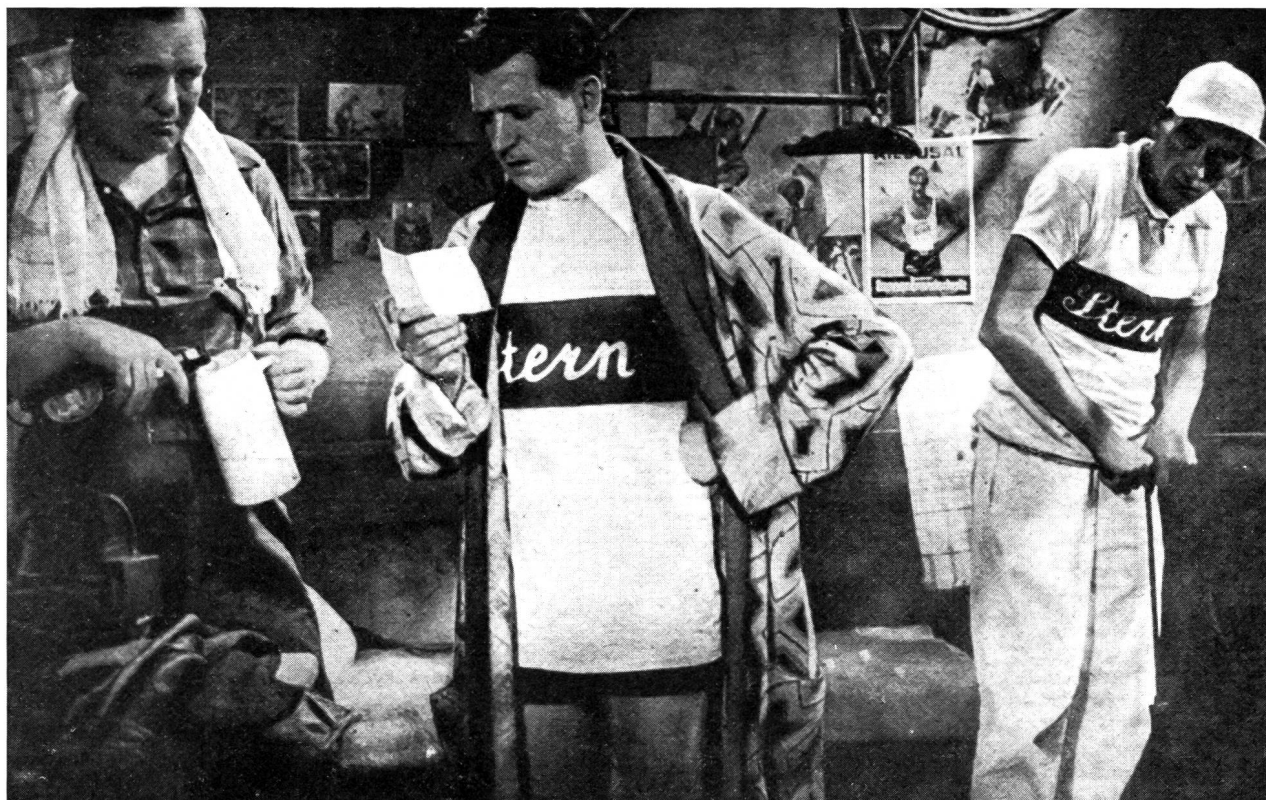
Albert Préjean, dans une scène de «Rivaux de la Piste», film de Serge de Poligny (1933). Dans le rôle de Willy Streblow, le Sayer, Albert Préjean joua «Juste». On reconnaît, à sa droite, le sympathique Aimos.