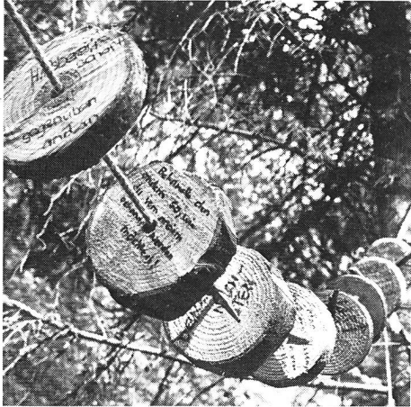
Les règles du camp